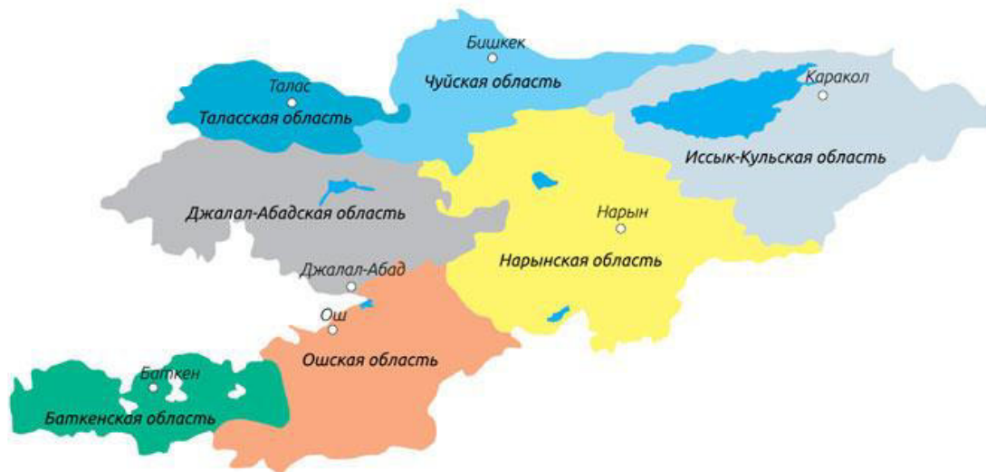
Рис. 1. Карта Кыргызской Республики по административно-территориальному делению.

На основании выделяемого финансирования со стороны ВБ и других партнеров по развитию в предлагаемый Проект, СВР включает магистральные и межхозяйственные каналы - 29 каналов в 18 районах 7 областях республики.